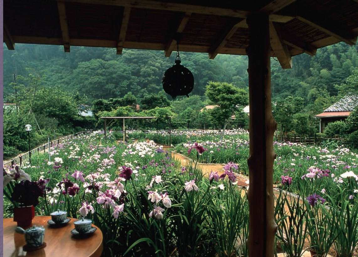
ISHIDAYA Traditional Japanese Style Inn Izu/Kawazu/Yatsu Spa