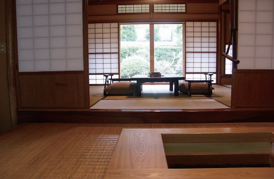
1室ごとに趣を変えた客室 昔ながらの和の意匠が光ります